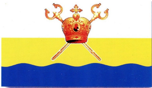
ПРАПОР МИКОЛАЇВСЬКОЇ ОБЛАСТІ

Николаев. Города районного значения: Баштанка, Новая Одесса, Новый Буг, Снигиревка.